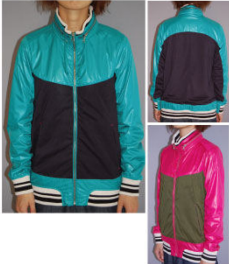
No. 375587 GFP カット MIX ジャージー