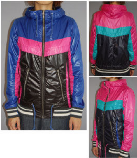
No. 375585 GFP 3 カラー V フーディ