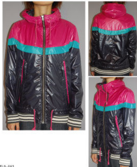
No. 375599 GFP 3 カラー カービーフーディ