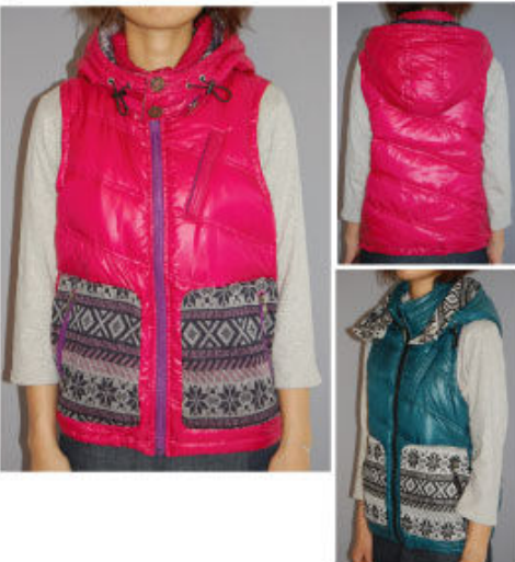
No. 375597 GFP ジャガード MIX 中綿ベスト