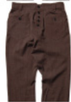
10:LIGHT BROWN x BLACK