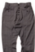
3:BLACK x BLUE

定番のカレッジプリントを復元しながらも、今季らしく 足せているポイントに独自の加工したダメージ加工の ため、ビンテージアイテムのような質感を再現し ています。袖は分袖タイプを選択しているため、重 ね着スタイルにも対応可能。袖の切りっ放し加工や、 首元の“割”など細かな部分にも気を配り、本格的 なアイテムに仕上がっています。中よりのあるシルエ ットなのでワイドパンツなど、合わせてシルエット のパンツと合わせるのがオススメです。