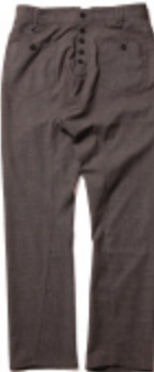
11:BEIGE x BLACK