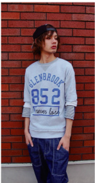
3 29DARK PINK